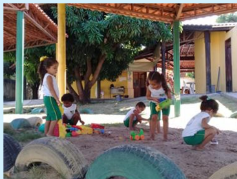
Crianças da Creche no parquinho de recreação