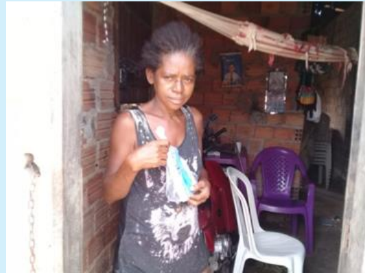
Entrega de máscaras às famílias carentes