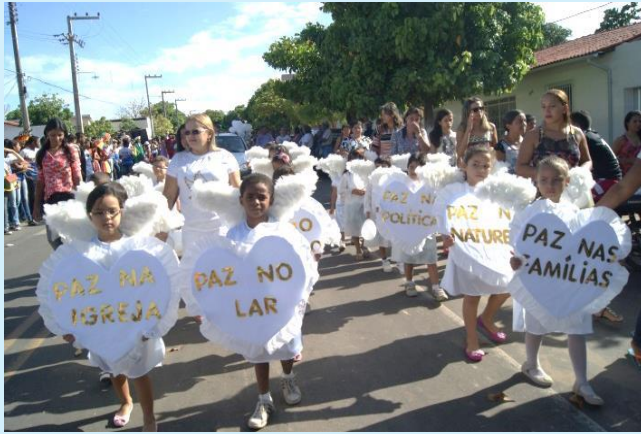
Campanha pela paz