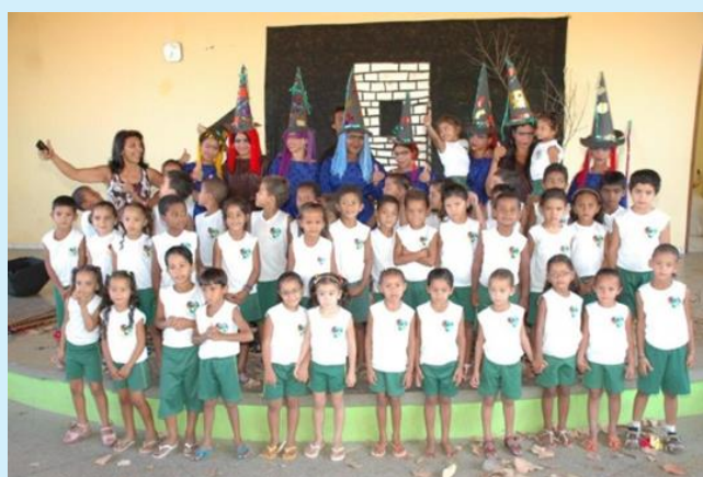
Apresentação de Teatro

A arte do teatro é desenvolvida com crianças e adolescentes das comunidades mais vulneráveis do nosso município, e tem como objetivo principal evitar que crianças e adolescentes sucumbam aos perigos e armadilhas decorrentes da ociosidade, trazendo-os para um ambiente acolhedor, focado, basicamente no desenvolvimento da capacidade de raciocínio. Busca-se aprimorar, também, a capacidade de associação da leitura de textos com a encenação e, como os ensaios são realizadas em grupo, essa acaba sendo uma excelente maneira de vencer a timidez, proporcionando uma maior desinibição, melhorando a capacidade de socialização. Desde a sua implantação, 290 crianças e adolescentes já participaram do projeto.