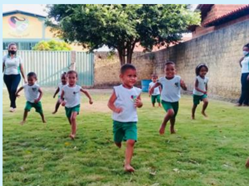
Recreação da Creche