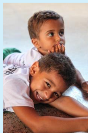
Crianças do Jardim de Infância