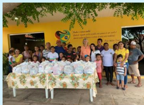
Entrega de cestas básicas para as famílias vulneráveis