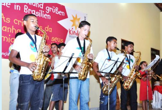
Aula de música – uma das muitas atividades da FP

O projeto musical já beneficiou mais de 250 crianças e adolescentes, promovendo neles mudanças comportamentais positivas, implicando em maior comprometimento com diversos aspectos ligados a uma responsabilidade social, devido à possibilidade de eles participarem, de maneira pró-ativa, em grupos, durante as aulas de flauta, de violão e de teclado, tendo-se obtido já, como resultados, a diminuição de casos de violências interpessoais e familiares e de envolvimento com produtos que causam dependência química.