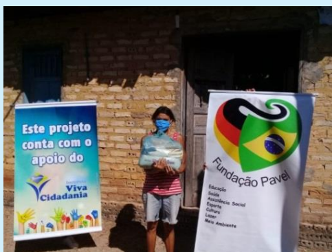
Entrega de cestas básicas nas comunidades carentes

Com essa iniciativa, a Fundação Pavel já beneficiou mais de 1.500 famílias das zonas rural e urbana do município de Barão de Grajaú-MA que, em sua maioria, são chefiadas por mulheres e, a expectativa é de que essa iniciativa continue alcançando aqueles que mais precisam de amparo.