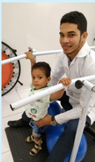
Atendimento de fisioterapia motora

Esse projeto, também, beneficia crianças, adolescentes e adultos, detentores de múltiplas deficiências e que necessitem de transporte para manter os seus tratamentos de forma contínua. Nesses casos, a Fundação cede os meios de transporte necessários.