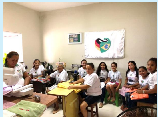
Curso profissionalizante de bordado à máquina