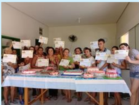
Curso de confeitaria

Todos esses cursos disponibilizados são de extrema importância para atender as demandas prementes existentes nas comunidades e, por isso, o projeto já beneficiou mais de 3.600 pessoas, que se tornaram profissionais autônomos e garantem seu sustento.