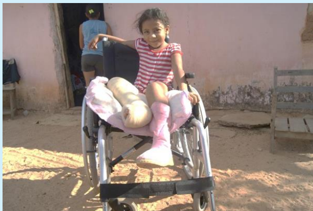
Entrega de cadeira de rodas para criança moradora da zona rural

Tem por finalidade precípua melhorar a mobilidade, em especial das pessoas que necessitam se locomover de forma mais independente, consistindo na entrega de cadeiras de rodas, medicamentos e material ortopédico para a população carente, que necessita de atendimento especial e não tem meios financeiros de provê-los. Nos últimos anos, mais de 80 cadeiras de rodas e cadeiras de banho foram entregues.