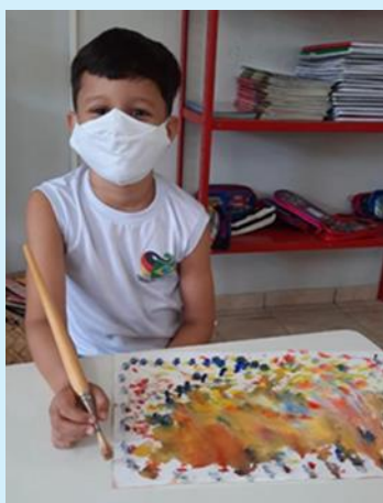
Atividade com aquarela

O desenvolvimento desses aspectos, de maneira holística, ocorre em espaço físico formal, onde as crianças são contempladas com alimentação, noções de religião, de preservação do meio ambiente, de higiene e limpeza, além do lazer, sempre respeitando o caráter lúdico das atividades. Assim, prioriza-se o desenvolvimento do ser humano na primeira infância, pois crê-se ser essa uma das fases mais importantes da vida, onde a criança inicia o desenvolvendo de seus sentidos, do seu pensar imaginativo, da sua capacidade criativa, estruturando seu corpo físico e sua mente, e principiando sua vida de interações, forjando princípios salutogênicos, que implicarão no desenvolvimento, ao longo de toda a vida, de um aprendizado constante, acerca das condições físicas e anímicas ou espirituais, que capacitam o ser humano a lidar, de forma adequada, com situações críticas e ambientes hostis. A contrapartida desse projeto de educação infantil, segundo testemunhos de cidadãos baronenses, é altamente positiva, tendo em vista as contribuições benéficas acarretadas na realidade local do município de Barão de Grajaú-MA, desde a implantação do projeto, no ano de 2007.