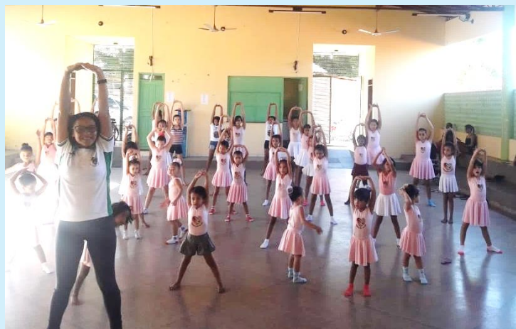
Aula de Balé infantil