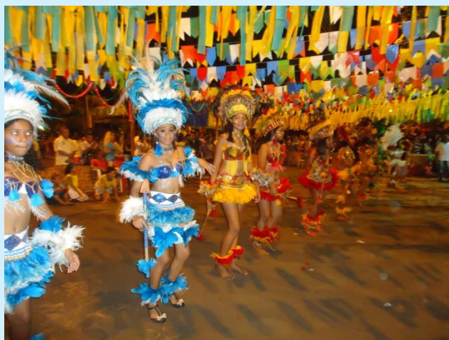
Apresentação do Boi Brilho das Nações