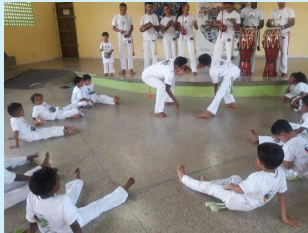
Aula de Capoeira

Dessa forma, busca-se, com a prática da capoeira desenvolver, nas crianças e adolescentes, o espírito de socialização, de concentração, de atenção e de confiança e respeito mútuo, envolvendo a família e a sociedade em geral, tentando mostrar que a prática da capoeira é um esporte saudável, e incentivando o hábito de cultivar a paz e evitar a violência. Até o momento, o projeto já atendeu, desde sua implantação, cerca de 1.500 crianças e adolescentes, que se encontram socialmente vulneráveis.