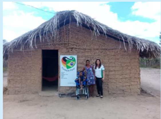
A FP ajuda! – uma cadeira de rodas para uma criança no interior do Maranhão.