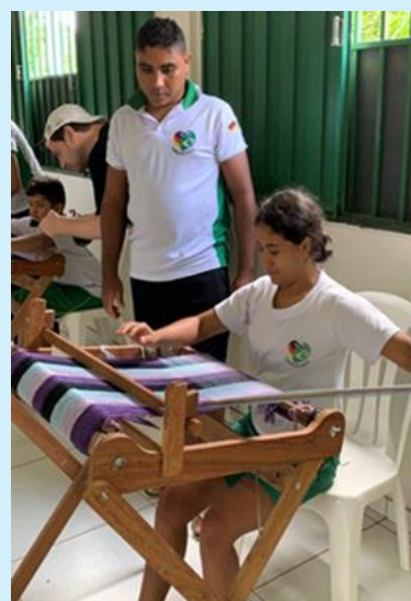
Atividade terapêutica com tear