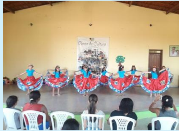
Apresentação folclórica tambor de crioula