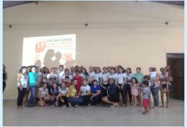
Palestra de combate ao abuso e exploração sexual contra criança e adolescentes