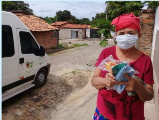
Entrega de máscaras para idosos