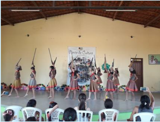
Apresentação folclórica de Xaxado